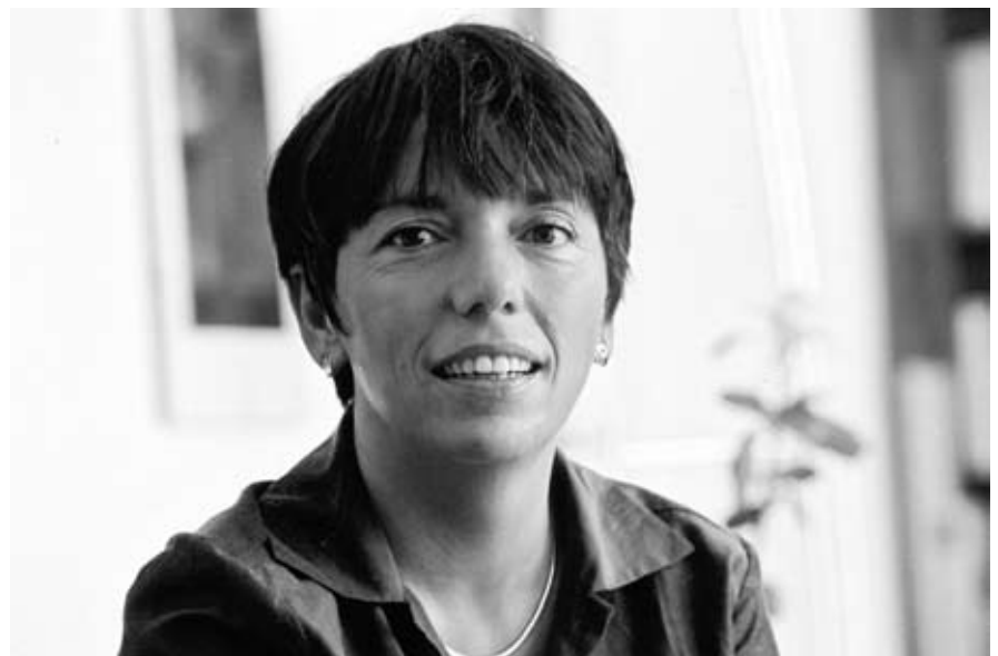
Bischöfin Margot Käßmann leitet die Landeskirche. Noch vor einigen Jahren völlig undenkbar.

In Niedersachsen gibt es noch vier weitere evangelische Landeskirchen: Die Evangelisch-lutherische Landeskirche in Braunschweig, die Evangelisch-Lutherische Kirche in Oldenburg, die Evangelisch-reformierte Kirche in Leer und die Evangelisch-Lutherische Landeskirche Schaumburg-Lippe. Zusammen mit der hannoverschen Landeskirche bilden sie die „Konföderation evangelischer Kirchen in Niedersachsen“. Die Konföderation vertritt die Interessen der evangelischen