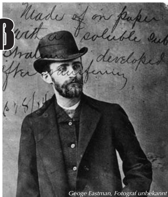
George Eastman