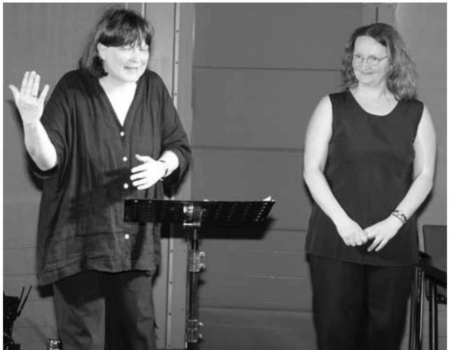
Bibelgespräch auf dem Kirchentag 2005 in Hannover.

Die Reformation brachte tiefgreifende religiöse und kirchliche Veränderungen in den niedersächsischen Raum. Viele Menschen haben Luthers Lehre von