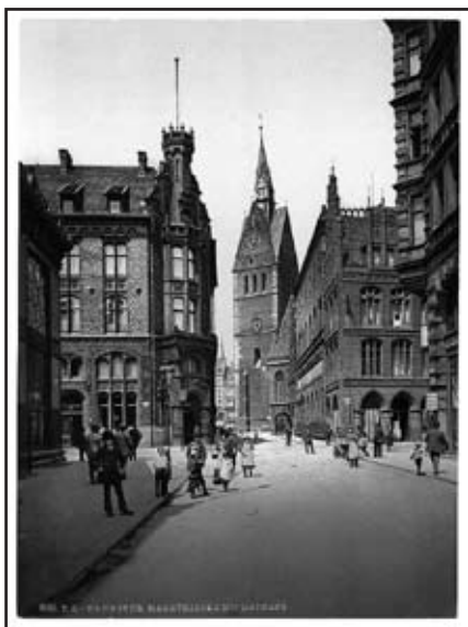
Die Marktkirche in Hannover. Ein altes Foto. Heute sieht die Gegend um die Kirche ganz anders aus. Nicht weit davon das Hans-Lilje-Haus, in dem oft Tagungen der Gehörlosenseelsorger stattfinden.

Der Name unserer Landeskirche ist irreführend: Evangelisch-lutherische Landeskirche Hannovers. Denn es geht nicht nur um Hannover! Unsere Landeskirche umfasst 81 Prozent der Fläche von Niedersachsen.