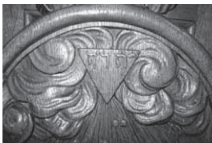
Der Gottesname JHWH als Schnitzwerk in einer Kanzel.

Der Name Gottes ist also bekannt! Trotzdem kennt man ihn nicht. In den Gebeten, im Gottesdienst und in der Bibel wird der Name Jahwe nicht benutzt. Warum? Sie kennen das zweite (bzw. dritte) Gebot: „Du sollst Gottes Namen nicht missbrauchen.“ Die Juden haben überlegt: Wer weiß? Vielleicht haben wir die besten Absichten. Und trotzdem ist eine kleine Unachtsamkeit in uns, wenn wir über Gott sprechen. Dann haben wir Gottes Namen aus Versehen missbraucht. Darum wollen wir den Namen Gottes gar nicht mehr benutzen. So können wir ihn auch nicht missbrauchen. Überall, wo in der Bibel „Jahwe“ stand, da haben sie „Herr“ gelesen. Und im Gottesdienst und in Gebeten haben sie Gott mit anderen Wörtern beschrieben: