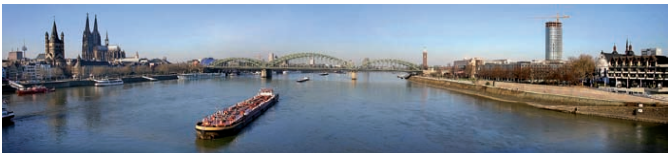
Blick auf den Rhein von der Deutzer Brücke aus.

W er für den Kirchentag nach Köln kommt, der sollte unbedingt auch ein wenig Zeit einplanen um die Stadt ein wenig kennen zu lernen. ri