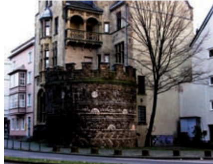
Ein gut erhaltener Turm aus römischer Zeit.

Die Bedeutung der Religion zeigt sich auch im Stadtwappen, auf dem die drei Kronen der „Heiligen Drei Könige“ und die 11 Flammen der heiligen Ursula und ihrer Gefährtinnen, die in Köln den Märtyrertod erlitten haben sollen, dargestellt sind.