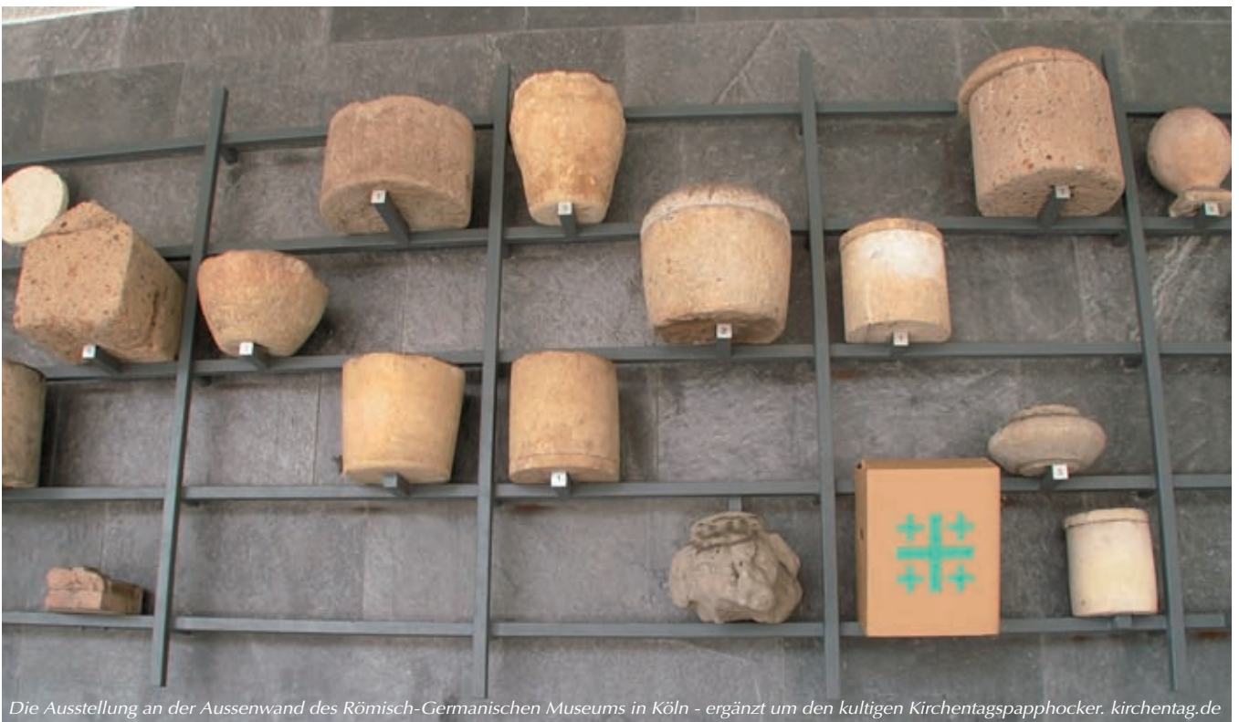
Die Ausstellung an der Aussenwand des Römisch-Germanischen Museums in Köln - ergänzt um den kultigen Kirchentagspapphocker. kirchentag.de