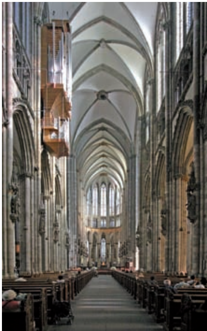
Innenraum des Kölner Doms, des Wahrzeichens der Stadt.

K öln kannte man bis zum Ende des ersten Weltkrieges auch als „Cöln“. Das „C“ im Namen ist eine Erinnerung an den Ursprung der Stadt, die von den Römern im Jahre 50 n.Chr. zur Stadt erhoben wurde und damals den Namen Colonia Claudia Ara Agrippinensium trug. Und da die Römer praktisch waren und den langen Namen auch nicht immer schreiben wollten, wurde er abgekürzt zu CCAA. Im Mittelalter trug die Stadt dann den Namen Coellen und die Kölner selbst nennen ihre Stadt seit jeher Kölle.