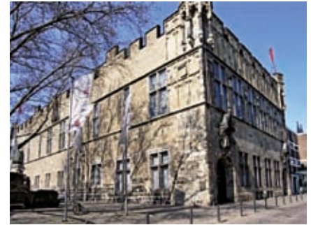
Im mittelalterlichen Gürzenich dient werden heute Konzerte und andere Veranstaltungen aufgeführt.

Mauern entdecken. In vielen Kirchen und alten Gebäuden findet man das Mittelalter wieder (zum Beispiel Rathaus, Stapelhaus, Gürzenich und Overstolzenhaus, das älteste erhaltene Wohngebäude der Stadt). Und der Festungsring und einige