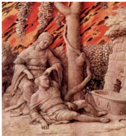
Andrea Mantegna, Dalia und Samson , 1495, National Gallery, London

verlässt sie der Mut. Und so werden sie alle erschlagen.