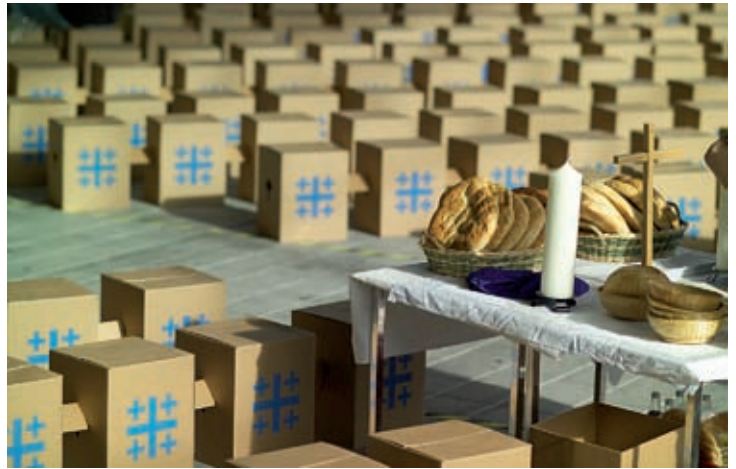
Papphocker und Feierabendmahl - beide sind fest mit dem Kirchentag verbunden. Und viele Besucher nehmen nach dem Kirchentag beides gegen eine kleine Gebühr mit nach Hause.

Die Bilder vom Kirchentag in einer Stadt gleichen sich immer wieder. Viele, vor allem junge Menschen, stehen dicht gedrängt vor U-Bahnen und an Straßenbahn-Haltestellen. Doch sie sehen nicht mürrisch oder genervt aus.