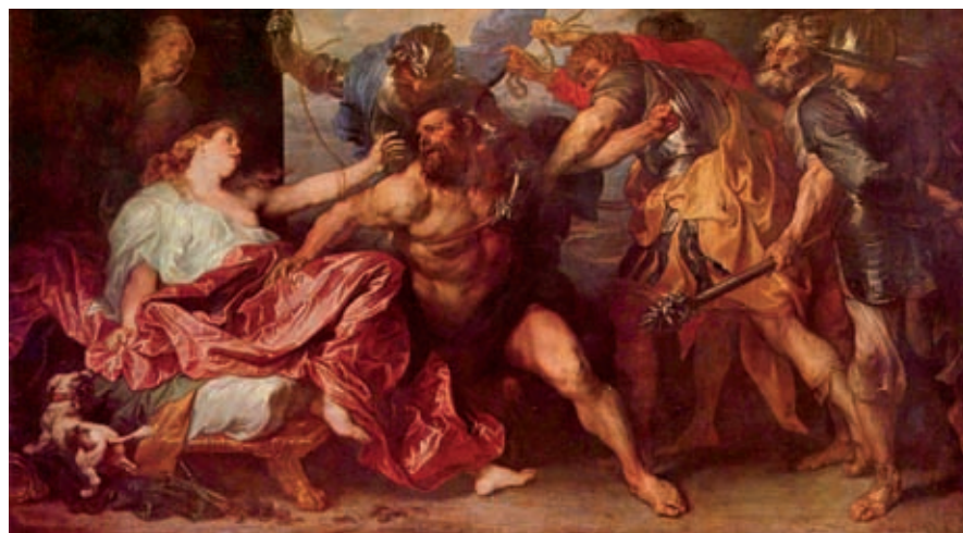
Antonis van Dyck, Simson und Dalila , 1. Drittel 17. Jh., Öl auf Leinwand, Kunsthistorisches Museum, Wien