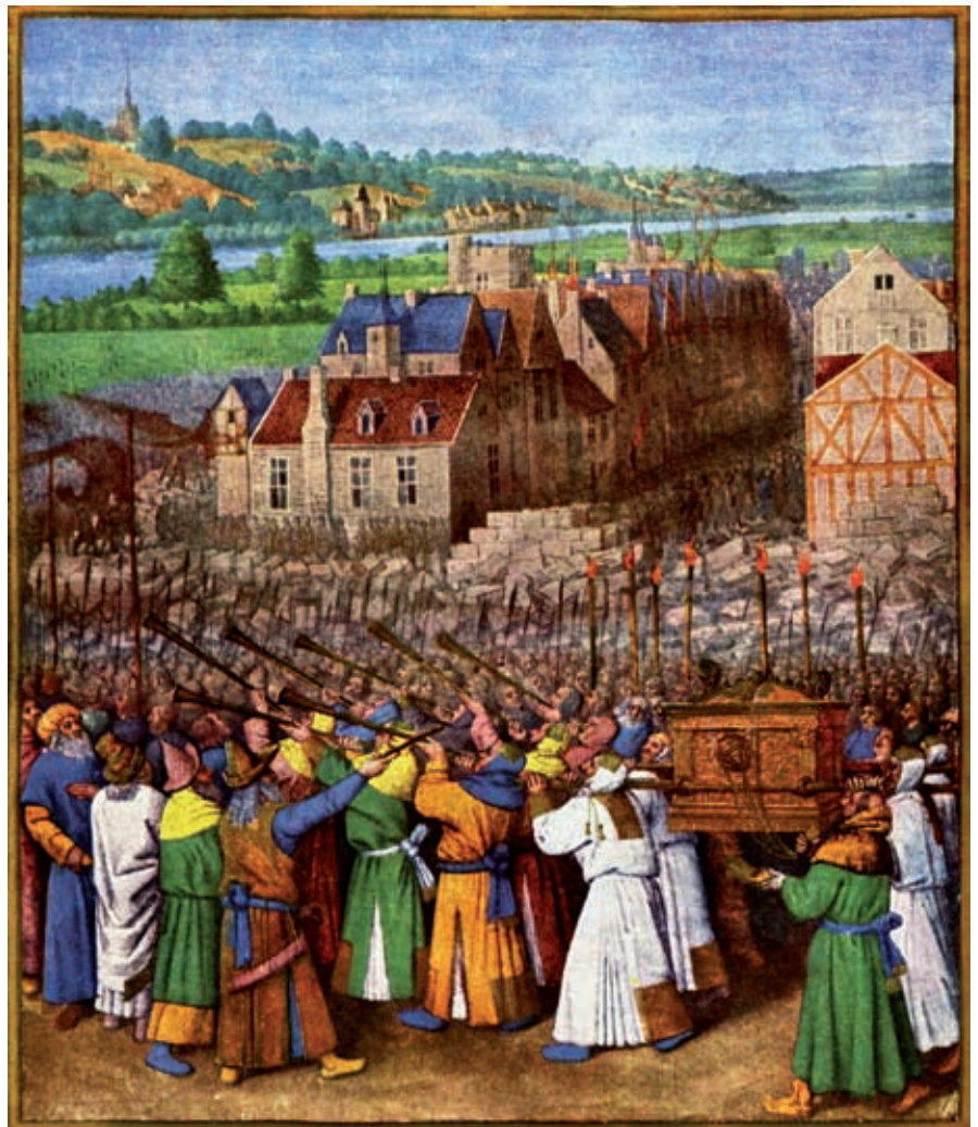
Die Trompeten von Jericho aus den Livres d'heures des Étienne Chevalier von Jean Fouquet, (um 1452-1460), Buchmalerei auf Pergament, Musée Condé (Chantilly)

Dann kommen die Israeliten und belagern die Stadt – aber das ist eine seltsame Belagerung: ohne Waffen und Kriegsgeschütz. Die Soldaten laufen nur jeden Tag einmal um die Stadt herum – sechs Tage lang. Am Ende des langen Kriegszuges gehen sieben Priester mit Posaunen. Sie blasen auf ihren Instrumenten. Sonst sind alle still. Am siebenten Tag gehen die Soldaten sieben Mal um die Stadt,