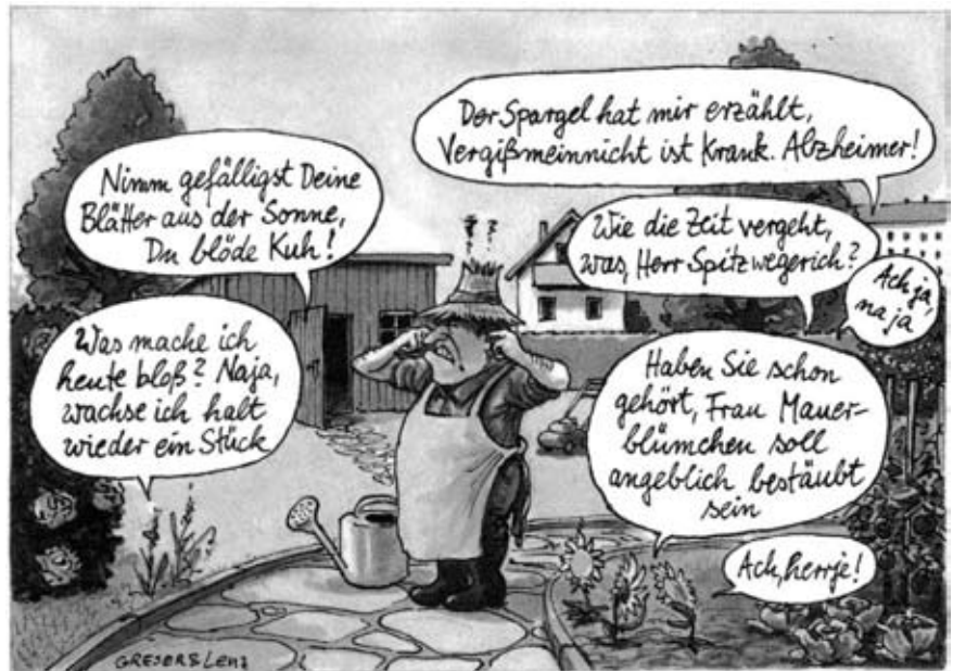
Genetechnik, Fluch oder Segen?