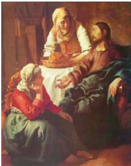
Jan Vermeer van Delft, Christus bei Maria und Martha, entstanden: vor 1654-1655

Da ist der reiche Mann, vor dessen Tür der arme Lazarus lebt: arm, krank und voller Leid. (Kapitel 16) Beide sterben. Lazarus kommt in den Himmel, der reiche Mann in die Hölle. Der reiche Mann wünscht sich, dass Lazarus seine Qualen etwas lindert. Aber das geht nicht. Da wünscht er sich: Lazarus soll noch einmal in sein Haus gehen, um seine Familie zu warnen, damit es ihnen nicht genauso geht wie ihm. Aber auch das ist unmöglich: „Sie sollen die Bibel lesen und danach leben.“ Ein auferstandener Toter ist kein Beweis – so steht es in