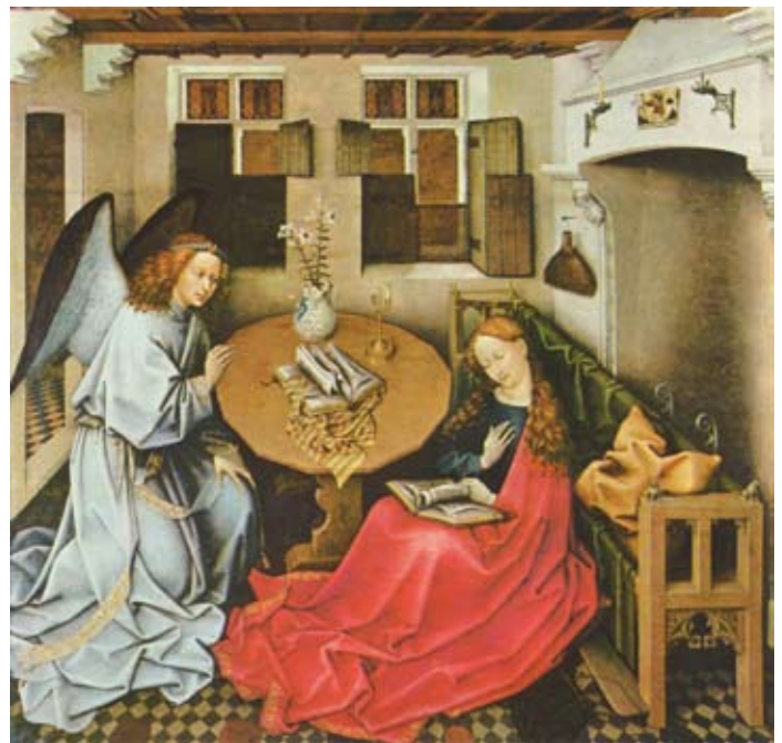
Die Verkündigung, Robert Campin, entstanden: um 1420-1440

Später – Jesus ist erwachsen und zieht als Wanderprediger durchs Land – kommt er in die Stadt Nain. Dort wird gerade ein junger Mann beerdigt. Und Jesus sieht die Mutter dieses Mannes. Sie ist Witwe und auf die Unterstützung durch ihren Sohn angewiesen. Jesus hat Mitleid mit