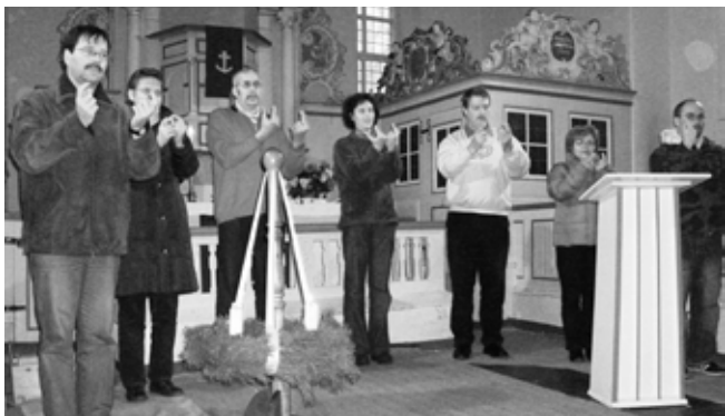
Der Gebärdenchor Nordost