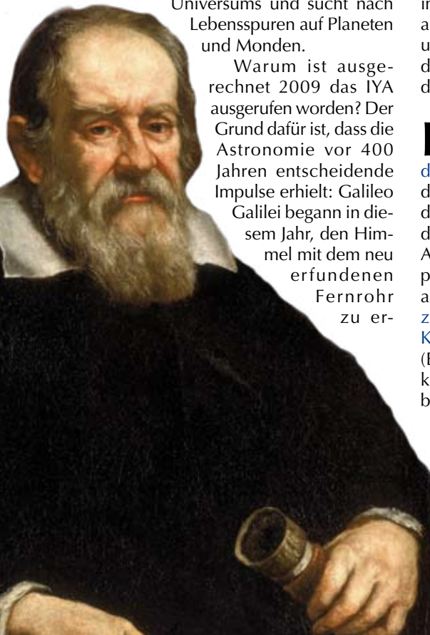
Galileo Galilei Porträt von Justus Sustermans, 1636