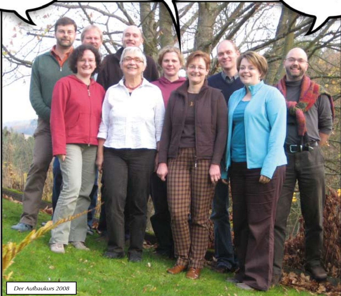
Der Aufbaukurs 2008