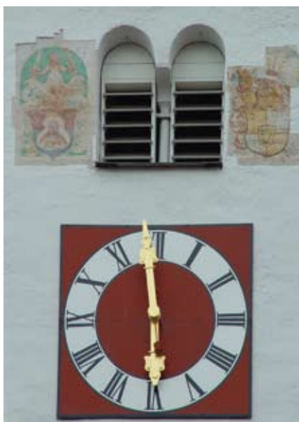
Kirchturmuhre in Bayern.