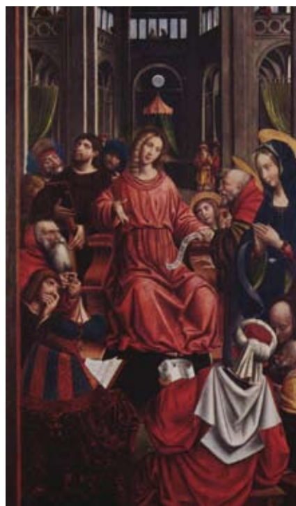
Defendente Ferrari, Der zwölfjährige Christus im Tempel, entstanden: 1526

ihr. Und um dieser Frau willen erweckt er den jungen Mann wieder zum Leben. (Kapitel 7)