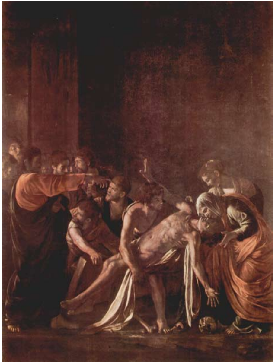
Michelangelo Caravaggio, Auferweckung des Lazarus, entstanden: 1609

dieser Geschichte, und so haben es die Christen später selbst erfahren mir ihrer Botschaft von der Auferstehung.