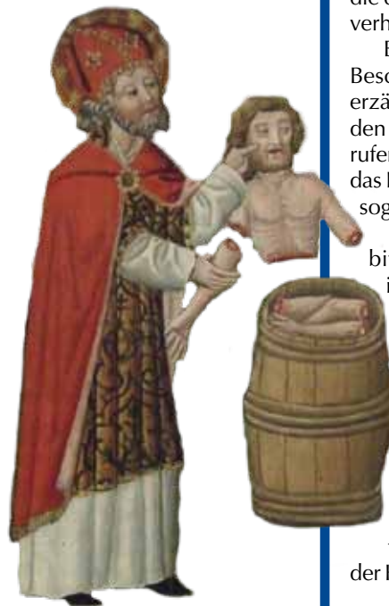
Auferweckung eines getöteten Scholaren durch den heiligen Nikolaus. Bild auf einer Altartafel in der Kirche St. Mariae in Mühlhausen in Thüringen.