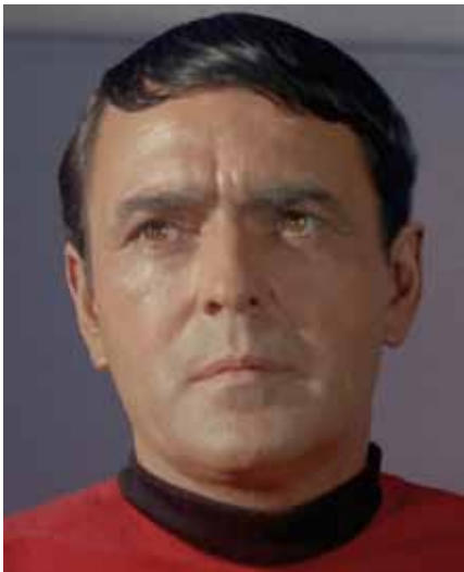
Scotty - wie man ihn aus der Fernsehserie und den Filmen kennt.

J ames Doohan (1920 - 2005) war zu Lebzeiten Schauspieler, bekannt durch die Rolle des „Scotty“ in der Fernseh- und Filmserie „Raumschiff Enterprise“. In den Filmen durchquerte er im Raumschiff das Weltall. Sein großer Traum war es, auch in Wirklichkeit einmal in den Weltraum zu kommen. Tatsächlich sollte ihm dieser Wunsch auch in Erfüllung gehen, aber erst nach seinem Tod: Eine Mini-Urne mit etwas von Doohans Asche flog 2007 an Bord