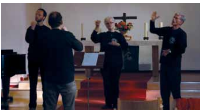
Der Gebärdenor während des Gottesdienstes.