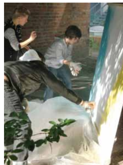
Im Workshop „Jugend kreativ“ (jube!³) wurde ein Bild für die Türkisparade gespragt.

Den krönenden Abschluss der Woche bildete eine große Parade – die sogenannte „Türkisparade“ – mitten durch das Zentrum Berlins. Ungefähr 2.000 Menschen marschierten mit Plakaten und Bannern durch die Stadt. Die Parade