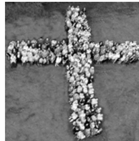
Alle zusammen ein Kreuz