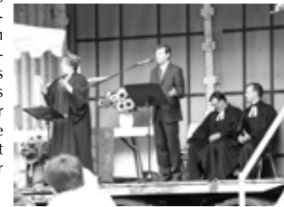
Oben: Grußworte des Dekans