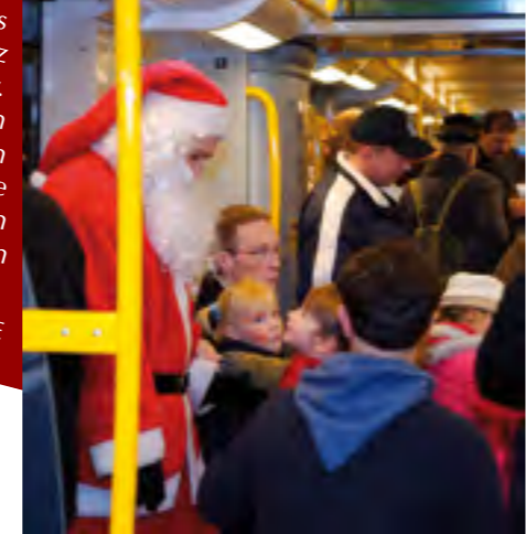
Heutzutage fährt der Weihnachtsmann mit der Berliner U-Bahn.