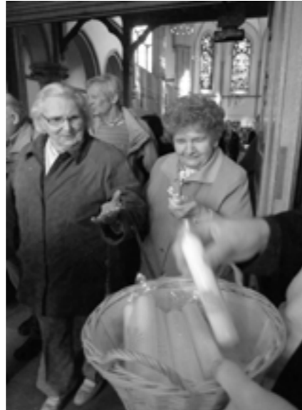
H.Korthaus/C.Schröder, Bilder: C. Pollmeier/H.Korthaus

den“ vor. Darin sollen in den nächsten 2 Jahren die Namen und Taufdaten möglichst vieler Gehörloser aus allen Gehörlosengemeinden gesammelt werden. So haben wir ein sichtbares Zeichen für die Gemeinschaft der Getauften. Den Abschluss des Gottesdienstes bildete das Tanztheater Pottborus. Nach dem Gottesdienst ging es in das Ludwig-Steilhaus, wo schon Kaffee und Kuchen wartete. Dort gab es auch Programm für Kinder und eine Fotoaktion. Alle, die wollten, konnten sich fotografieren lassen und die Fotos wurden auf einer großen Wand als Zeichen für die Gemeinschaft gesammelt. Ein besonderer Höhepunkt war das Quiz zum Thema Taufe. Dabei gab es viele Preise zu gewinnen. Ein herzliches Dank alle Mitarbeiter die dieses schöne Fest ermöglicht haben.