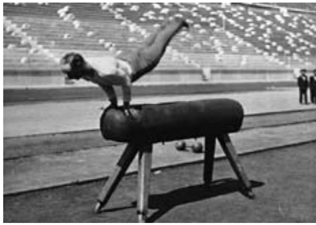
Der Deutsche Carl Schuhmann belegte mehre erste Plätze in verschiedenen Sportarten

sportwoche“. Das IOC erklärte diese Veranstaltung dann nachträglich zu den ersten Olympischen Winterspielen. Bis 1992 fanden Winterspiele und Sommerspiele immer im selben Jahr statt, dann gab es bereits nach zwei Jahren wieder Winterspiele (1994 in Lillehammer). Seither sind alle zwei Jahre Olympische Spiele: einmal Winterspiele, einmal Sommerspiele.