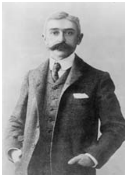
Pierre de Coubertin (1863 - 1937),

Die olympischen Spiele stammen aus dem 8. Jahrhundert vor Christus. Alle vier Jahre wurden sie in Olympia ausgetragen, einem Heiligtum auf der griechischen Halbinsel Peloponnes. Die Spiele waren ursprünglich eine Mischung aus religiösem Fest und sportlichem Wettkampf. Zur Sicherheit der Athleten galt für die Dauer der Olympischen Spiele eine strenge Waffenruhe. So konnten auch Angehörige verfeindeter Völker und Stämme an den Wettkämpfen teilnehmen. Mehr als 1000 Jahre lang bestand diese Tradition, im 5. Jahrhundert nach Christus war Schluss damit.