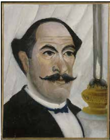
Selbstportrait von Henri Julien Félix Rousseau, genannt „Le Douanier“, 1902/03

Im Jahr 1886 fand der französische Maler Henri Rousseau (sprich: Russoh) mit diesem Bild erstmals Beachtung in der Pariser Kunstwelt. Rousseau (1844 - 1910) war Autodidakt, das bedeutet: Er hatte keine Kunstausbildung. Er hat sich die Malkunst selbst beigebracht. Von Beruf war er ein kleiner Finanz- oder Zollbeamter in Paris. Deshalb wird er oft auch „Rousseau, der Zöllner“ genannt. Im Alter von etwa 35 Jahren begann er zu malen. Sein Stil wird oft als ‚naiv‘ bezeichnet. Typisch für naive Malerei sind farbenfrohe Bilder, die ohne feste Regeln (zum Beispiel: Perspektive, Schatten, Lichteinfall) gemalt sind. Manche sehen auch aus wie von Kindern gemalt. Rousseau musste viel Spott ertragen von den ‚richtigen‘ Künstlern und den Galeriebesitzern in Paris. Doch nach und nach erkannten auch die Fachleute, dass Rousseau