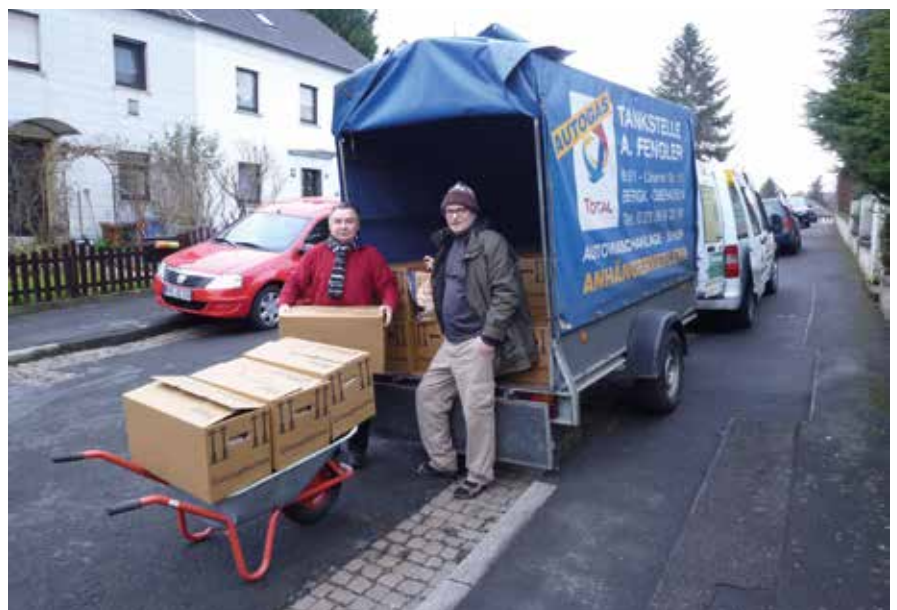
Noch sind alle zuversichtlich. Die Kisten mit den Weihnachtsfreude-Päckchen kommen in den Anhänger. Leider konnten sie noch nicht nach Afrika geschickt werden.