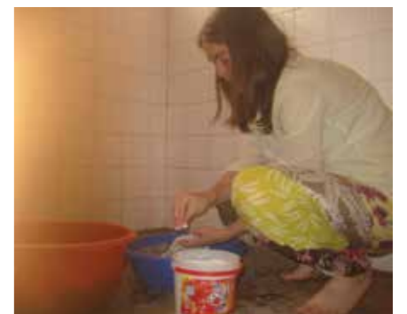
Abwaschen in Tansania.