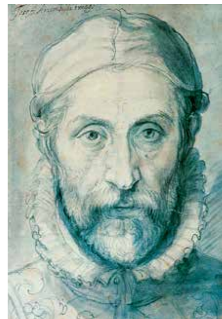
Selbstportrait des Malers Giuseppe Arcimboldo

Wir sehen eine Gestalt, deren Rumpf aus Fass-Dauben besteht, also aus den Holzplanken eines Fasses. Der Hals und das Gesicht sind aus vielen verschiedenen Herbstfrüchten zusammengesetzt: Obst, Gemüse, Getreide und (als Ohr) einem Pilz. Die Frisur besteht aus vielen Weintrauben. Den Blumenrahmen um diesen „Herrn Herbst“ herum hat ein späterer Künstler