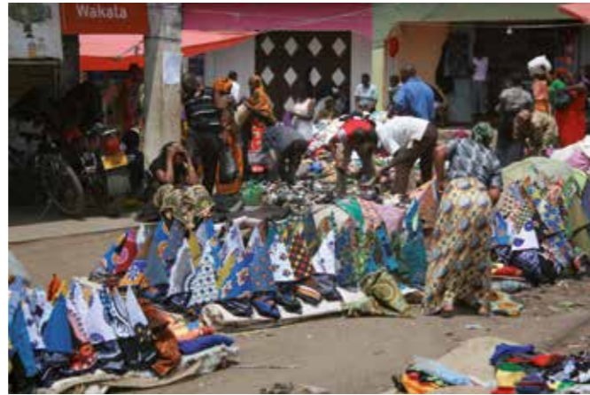
Verkaufsstand für Kangas auf dem Markt in Mwanga.

D as habe ich zum Beispiel auch gemerkt, als ich mir am Wochenende einen Kanga gekauft habe. Kangas sind eine der Stoffarten, die die Frauen hier tragen. Ein bißchen sieht es aus wie ein langer Wickelrock. Man kauft einen Kanga