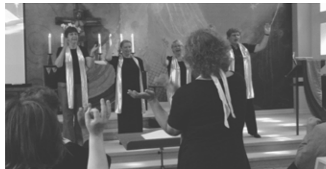
Dresdner Gebärdenchor im Festgottesdienst

Gemeinsam feiern, lachen und gebärden, Erinnerungen austauschen; dies alles hat unsere Partnerschaft mit neuem Leben