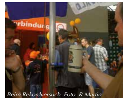
Beim Rekordversuch.

Georg streckte seinen Arm aus. Er musste den Krug genau vor eine Mess-Schranke halten. Die Zeitanzeige