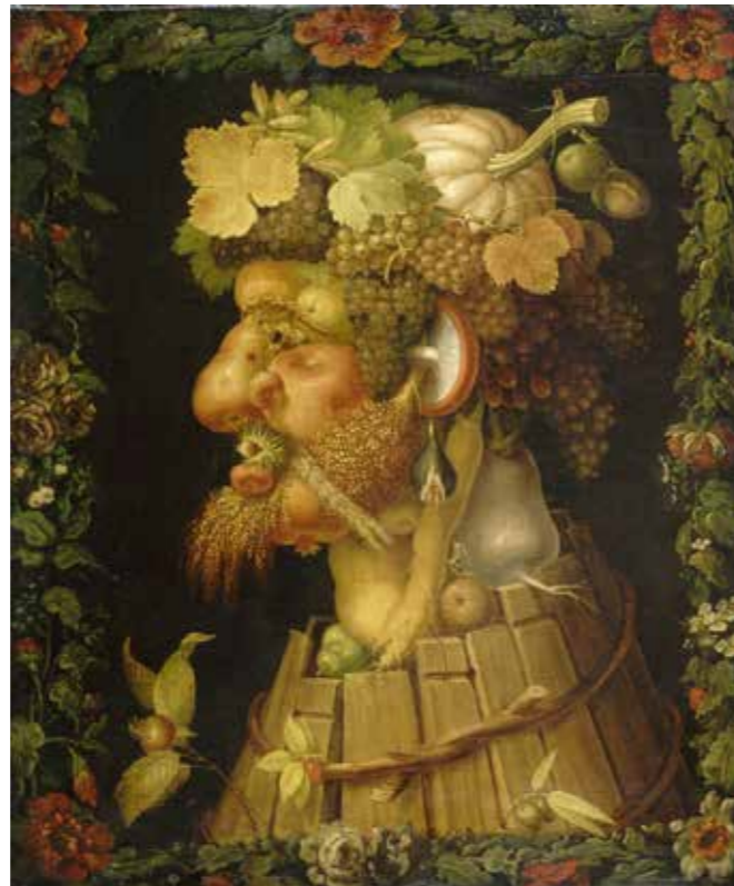
Das Bild „Herbst“ aus dem Zyklus „Die vier Jahreszeiten“ von Giuseppe Arcimboldo (1573). Es hängt heute im Louvre in Paris

Als Beispiel sehen Sie hier das Bild „Der Herbst“ von 1573. Es ist 76 x 63,5 cm groß und gehört zu einer Bilder-Serie „Die Vier Jahreszeiten“. Kaiser Maximilian II. hat die Serie in Auftrag gegeben und sie dann dem Kurfürsten von Sachsen geschenkt.