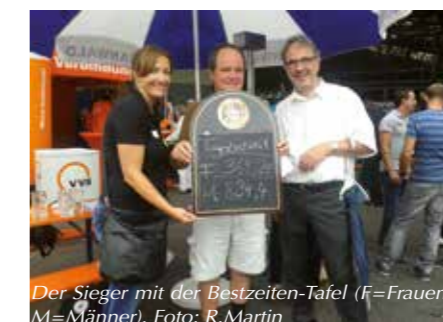
Der Sieger mit der Bestzeiten-Tafel (F=Frauen, M=Männer).

Georg streckte seinen Arm aus. Er musste den Krug genau vor eine Mess-Schranke halten. Die Zeitanzeige