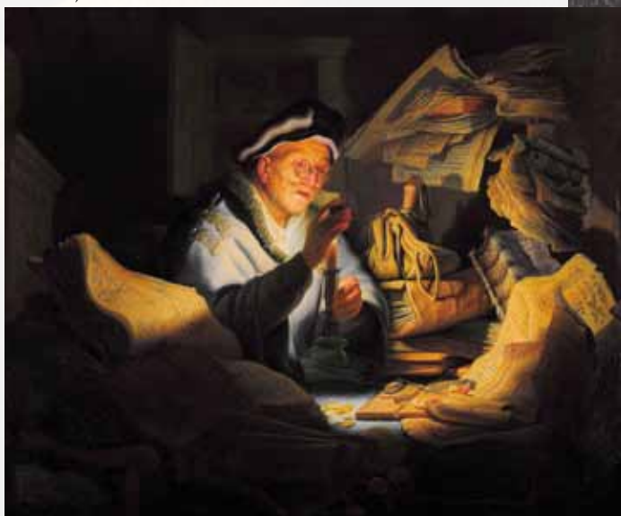
Rembrandt: Der reiche Kornbauer nach Lukas 12,16-21