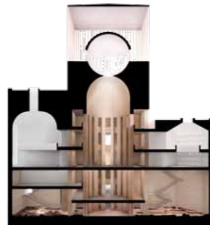
Fotos © Kuehn Malvezzi Architekten Oben: „Stadtloggia“ Mitte: Perspektive Brüderstraße Unten: Gebäudeschnitt

Weitere Informationen unter www.house-of-one.org