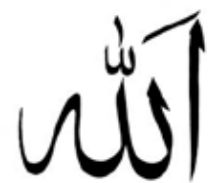
Arabisches Schriftkunst: „ALLAH“

An diesem Tag des gemeinsamen Gebets teilen Al-Azhar und seine Ulema [islamische Rechts- und Religionsgelehrte, Anm. d. Red.] in tiefer Überzeugung den Aufruf für den unmittelbar und untrennbar mit der Gerechtigkeit verbundenen Frieden. [2]