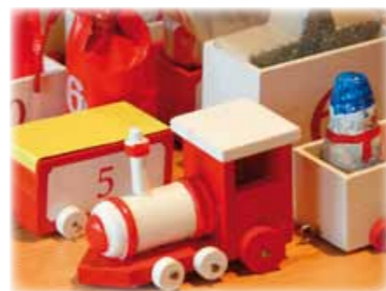
Abbildungen: Oben Mitte: „Weihnachtskalender“ von 1903