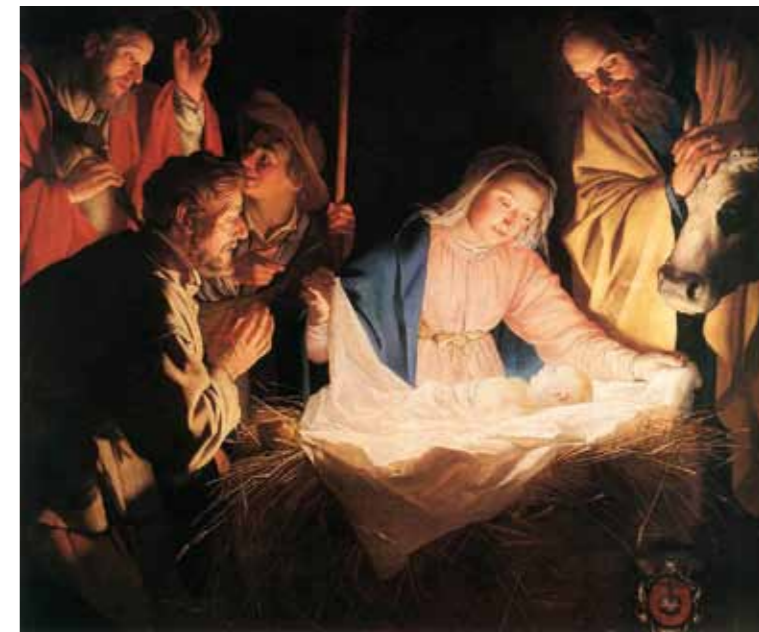
Gerrit van Honthorst (1592-1656): Anbetung der Hirten

Als vor 2000 Jahren die Hirten auf dem Feld die Nachricht über die Geburt von Jesus erhielten, lauteten die Worte: „Fürchtet euch nicht, denn siehe, ich verkündige euch große Freude!“ Seit damals hat sich unsere Welt verändert, sie ist moderner geworden. Wenn es heute draußen dunkel wird, können wir es dank des elektrischen Lichtes wieder hell werden lassen. Und unsere Inneres? Was wird aus unseren Ängsten und Sorgen: die Angst vor Krankheiten, vor dem Alleinsein und vor dem Fremden, die Sorge um den Frieden in der Welt und in unserem Umfeld?