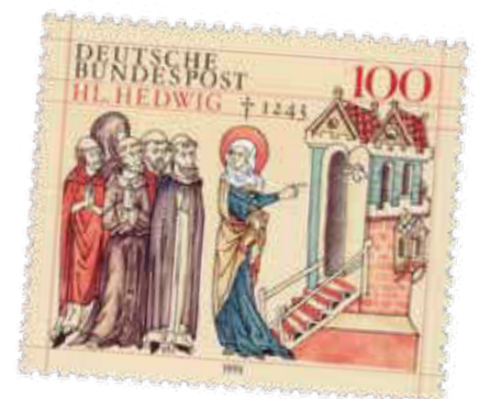
Foto oben: „Passau Niedernburg HI Hedwig“ Foto Mitte: Hedwigstatue aus Görlitz, Hedwig „trägt“ Schuhe und geht trotzdem barfuß Abbildung unten: Sondermarke der Deutschen Bundespost zu Hedwigs 750. Todestag