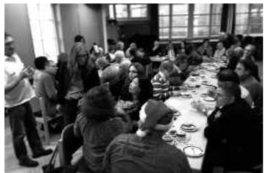
Anschließendes Treffen im Gemeindehaus

in Weil der Stadt stellt künftig Kirche und Gemeindehaus zur Verfügung und heißt die Gehörlosengemeinde willkommen. Das ist ein idealer Ort: Nur 200 Meter entfernt ist der Bahnhof mit S-Bahn-Verbindung.