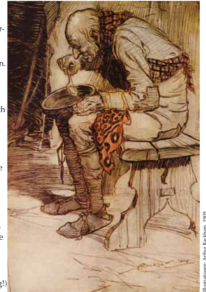
Illustrationen: Arthur Rackham, 1909

Da sahen sich die Eltern eine Weile an und begannen dann zu weinen. Sofort holten sie den Großvater wieder an den Tisch, er durfte wieder