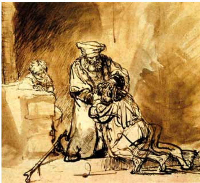
Bild: Rückkehr des „verlorenen“ Sohnes (Lukas 15,20), Feder-Zeichnung von Rembrandt van Rijn, um 1642. Gleichnis Jesu für den liebenden, barmherzigen Gott.