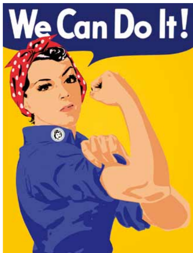
Abbildung links: Bekanntes Motiv zur Frauenemanzipation im Comic-Stil (gemeinfrei) Der Englische Titel bedeutet „Wir können das (selbst)!“

In der September-Ausgabe waren die Augen verschiedener Prominenter zu sehen. Haben Sie sie erkannt? Obere Reihe: Franz Beckenbauer / Albert Einstein / Angela Merkel. Mittlere Reihe: John F. Kennedy / Dietmar Bär (Schauspieler, Tatort) Untere Reihe: Sean Connery (Schauspieler, James Bond) / Jacqueline Kennedy