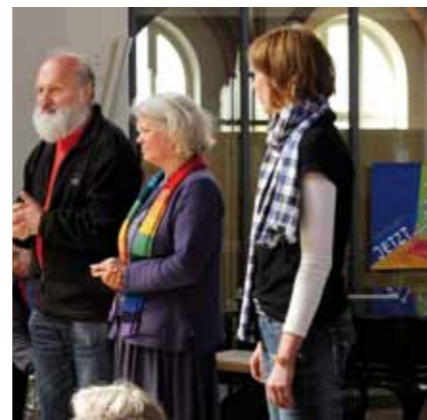
Fotos: DEKT/Jan-Peter Boening: Bischof Markus Dröge, Berlin; Christina Aus der Au, Präsidentin des 36. DEKT, Ellen Ueberschar, Generalsekretärin des Kirchentages bei der Vorstellung des Kirchentagsmottos --- DEKT/Alasdair Jardine: Abend der Begegnung beim 35. DEKT in Stuttgart

der uns sieht. Aber der Kirchentag ist auch eine wunderbare Möglichkeit, dass Menschen sich begegnen. In diesem Sinne: „Wir sehen uns“ – beim Kirchentag!