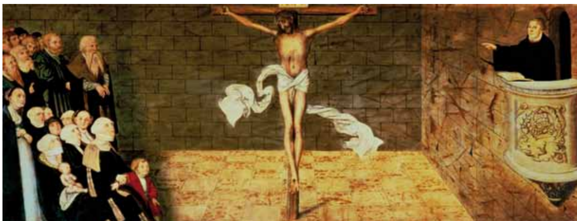
Bilder: Predella (= unterer Teil) des Reformationsaltars von Lucas Cranach dem Älteren und seinem Sohn, Lucas Cranach dem Jüngeren; vollendet 1547. Oben: Ausschnitt daraus