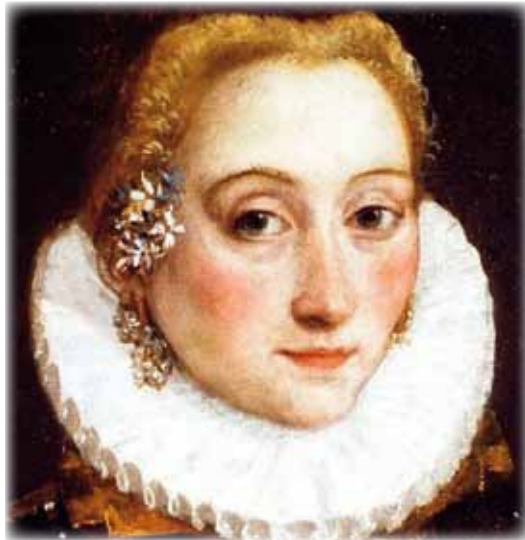
Olympia Fulvia Morata (1526 - 1555)

... das klingt nicht deutsch? – Stimmt! Die Gedanken der Reformation „flogen“ über die Grenzen hinweg und auch die Schriften Luthers wurden weitergereicht – unter anderem bis nach Italien.