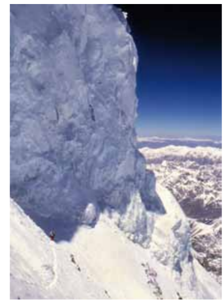
K2 - etwa 300 Meter unterhalb des Gipfels

„Vertical Limit“ ist Englisch. Vertical bedeutet „senkrecht“. Limit bedeutet „Grenze, Begrenzung oder auch Obergrenze“. Der Titel soll vermutlich sagen, dass es im Bergsteigen nichts