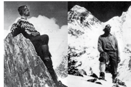
Drei der erfolgreichsten aus dem Kreis der Münchner Bergfreunde: