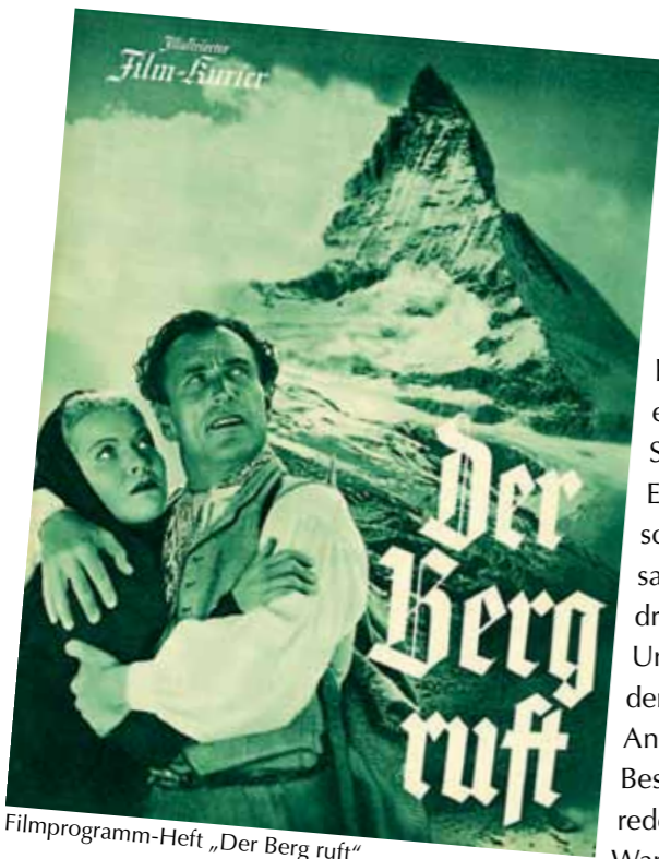
Filmprogramm-Heft „Der Berg ruft“

Das Thema dieses Films „Der Berg ruft“ ist die Erstbesteigung des Matterhorns (4.478 Meter hoch). Trenker führte in diesem Regie und spielte außerdem die Hauptrolle.