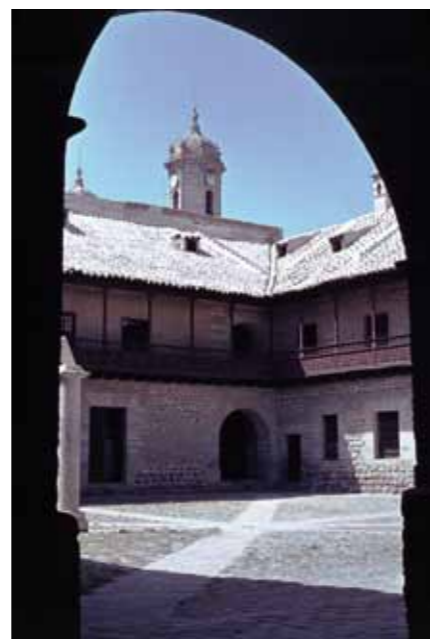
Blick in den Innenhof des Münzen-Museums von Potosí. Figur oben links: Weinlaub und -trauben am Kopf und habgieriger Blick nach Silber und Gold.