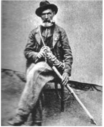
J.-A. Carrel, er bezwang das Matterhorn als erster von Italien aus.