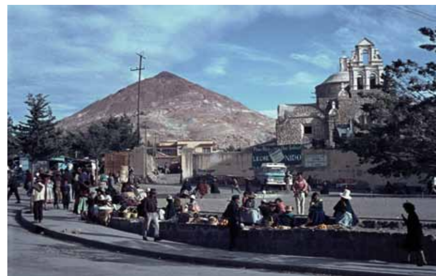
Der Silberberg. Im Vordergrund: Frauen verkaufen Gemüse an der Straße.