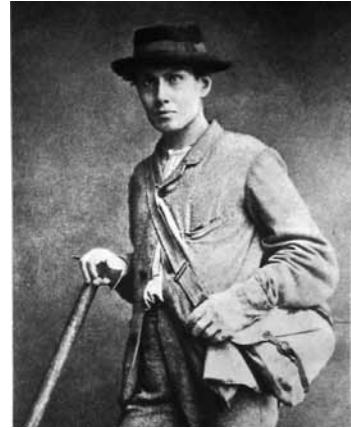
Edward Whymper als junger Mann, der Erstbesteiger des Matterhorns.

Luis Trenker war ein österreichisch-italienischer Bergsteiger, Bergführer, Schauspieler und Regisseur. Durch seine Bergfilme war er in Deutschland bekannt und beliebt. Und das lag vor allem an seinem Film mit dem Titel „Der Berg ruft“, der im Jahr 1938 in die Kinos kam und die Menschen begeisterte.