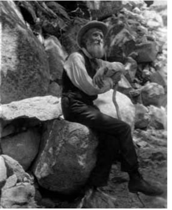
John Muir, der große schottisch-amerikanische Gelehrte (1907)