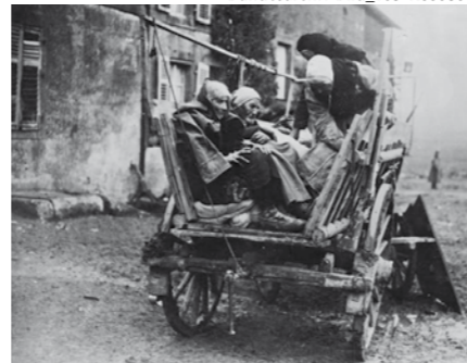
1. Weltkrieg, Flüchtlinge an der Westfront

verlassen, alles zurücklassen. Nur mit ein wenig Handgepäck in ein fremdes Land ziehen - ohne Sicherheit, ohne Garantie, dass ich dort bleiben darf. Ehrlich gesagt: Ich kann mir eine solche Situation nicht vorstellen.