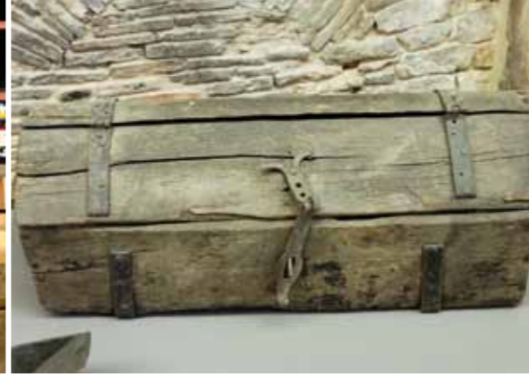
Seekiste eines Matrosen 19. Jh.