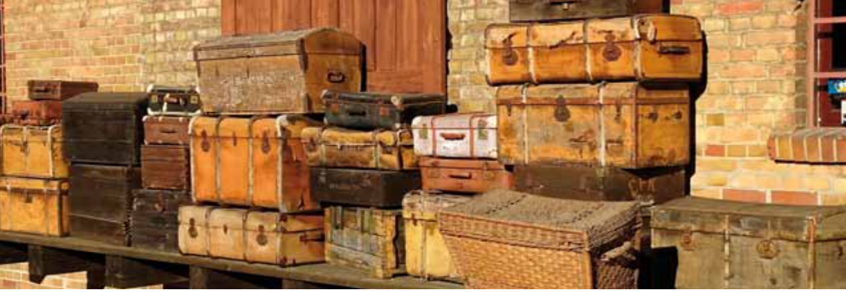
Alte Gepäckstücke, ausgestellt vor einem stillgelegten Bahnhof