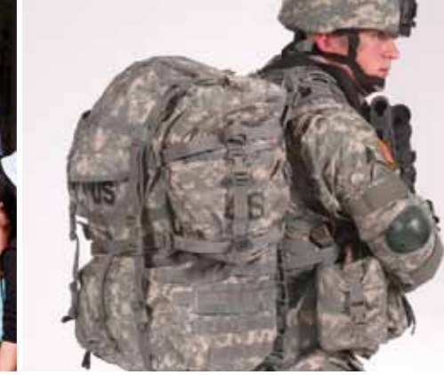
Dieser Rucksack ist bestimmt sehr schwer!