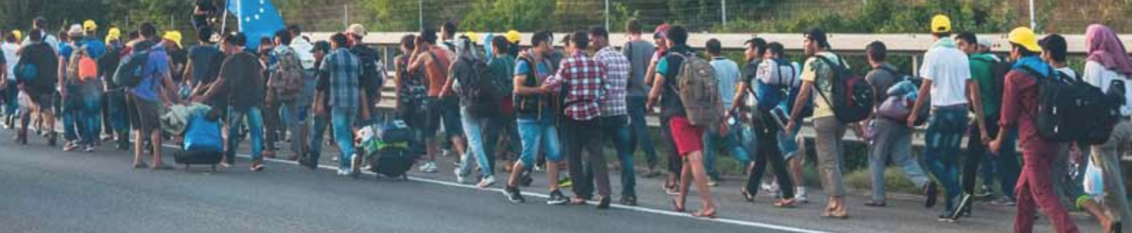
Flüchtlinge auf dem Weg von Ungarn nach Österreich