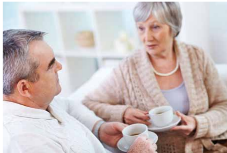
Lasten los werden: Das geht am Besten im Gespräch

Es gibt dafür viele gute Ratschläge: Du musst dich ablenken. Was Schönes machen. Nicht so viel an die schweren Zeiten denken. (Und vor allem nicht davon erzählen – wer will das schon hören?) Das Leben geht weiter. In die Zukunft schauen. Positiv denken! Hört sich nett an. Hilft aber nicht.