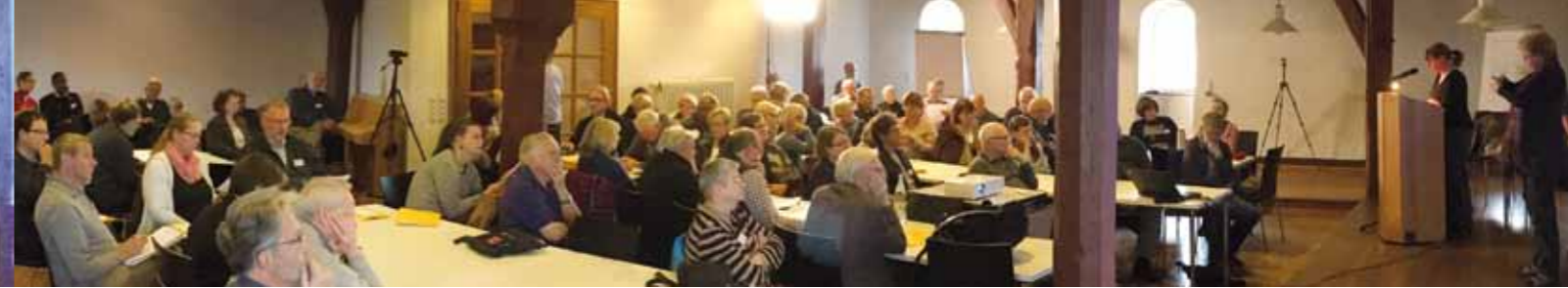
Mit großer Aufmerksamkeit folgten alle Anwesenden den Vortrag.